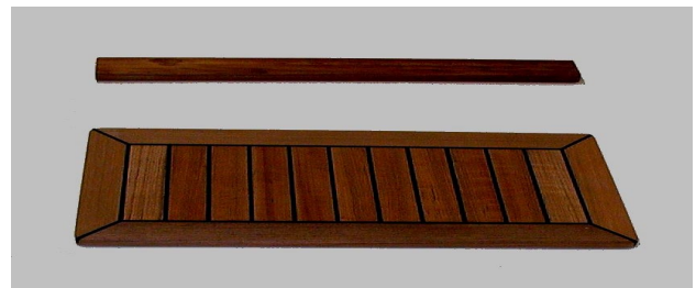
Hanse 411, Trittstufe und Teakdeck für Niedergang Salon