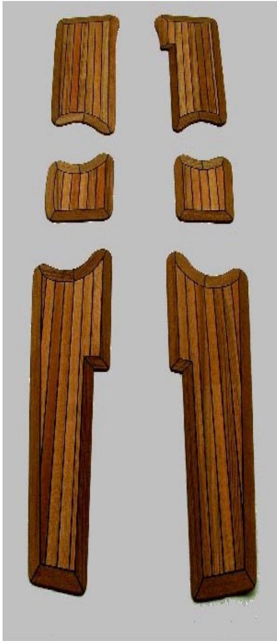
Hanse 411, Teakdeck für die Winschpodeste