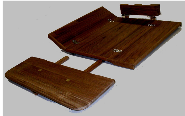
Hanse Yachten, Cockpit-Steuersäulentisch mit Verlängerung und Befestigungsgarnitur für Steuersäule.