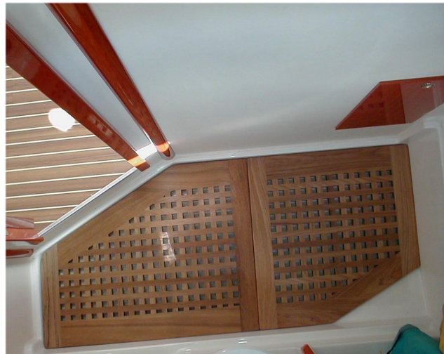
Hanse 341, 2 Kabinen, Grätting für die Naßzelle